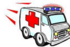
Rys. 26 Rozmieszczenie nowych ZRM